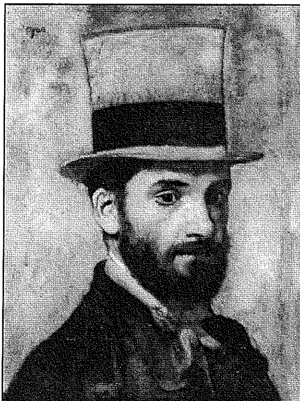
Bonnat peint par Degas

Si vous allez à Bayonne, faites un détour pour voir le Musée Bonnat, 5, rue Jacques Laffitte, 64100 Bayonne (tél. 59 59 08 52). Cela vaut le déplacement.