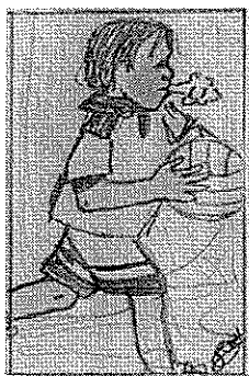
Dessin: Lucie Roy (12 ans)