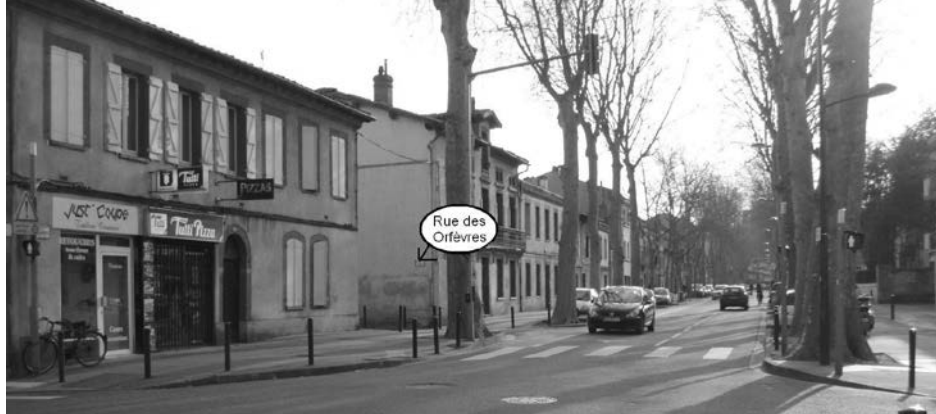
► Avenue Crampel: le débouché de la rue des Orfèvres qui servait de "raccourci" à l'octroi!

À l'initiative du Conseil Municipal des Enfants, le 6 mai à 14h15. Infos et inscription à la Maison de quartier. ■