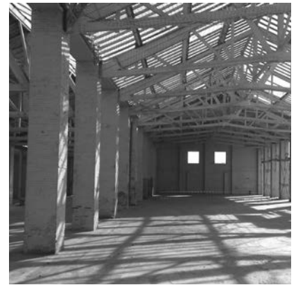
▲ Le hangar d'aviation en cours de restauration

Plus d'infos : www.toulouse-metropole.fr/-/la-piste-des-geants-prete-au-decollage-sur-le-site-de-montaudran-aerospace