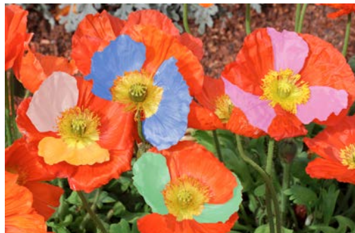
▲ Papaver versicolor tapicoli