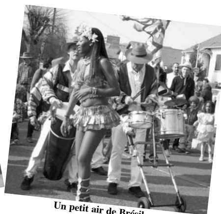
Un petit air de Brésil.