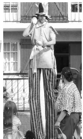
Il fait bon, là-haut ? !