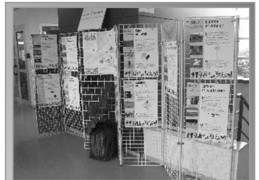
Exposition sur Les droits des enfants qui a eu lieu à la Maison de Quartier du 18 au 31 janvier

Un prochain rendez vous est proposé le 2 mars à 18h au CIO sur « l'orientation des enfants ». Annie C.