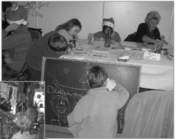
Sur le stand des Echos

Ce matin un papillon à lunette virevoltait dans le jardin de Ranguel. Il vit de ses yeux amusés une petite fille blonde ramasser des escargots pour les élever dans une boîte à chaussures. Secrètement elle espérait les voir pondre. Mais point d'œuf à l'horizon. Angeline