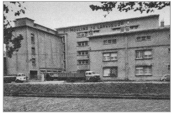
Les Grands Moulins du Languedoc, photo extraite du livre "Légendaires Moulins à Eau" de Pierre Mercié

Il n'y avait pas de moulin à eau sur le canal au pont des Demoiselles car les écluses se trouvaient ailleurs, rue Bayard, rue Matabiau et aux Minimes permettant l'existence de 3 moulins. Mais place Jules Julien, le grand immeuble du magasin Grandeur Nature était la minoterie de la Société des Moulins du Château Narbonnais produisant jusqu'à 40