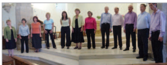
Allegro à Rulhac

Créé en 2003, l'ensemble vocal toulousain Allegro s'est donné pour but de promouvoir l'art polyphonique. Il se produit régulièrement en Midi-Pyrénées, Aquitaine et Languedoc-Roussillon.