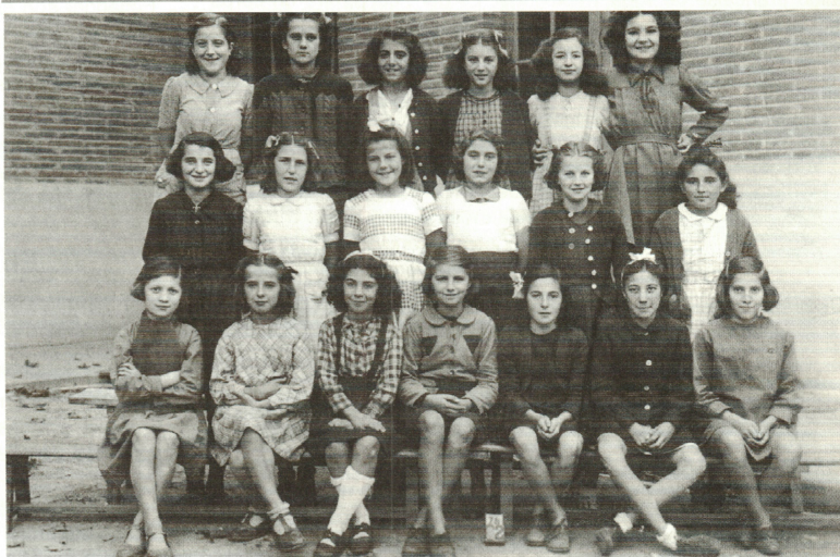
Le 29 octobre 1933, inauguration de l'école Jules-Julien

seurs diplômés (clubs ou service Sport pour Tous de la Mairie). Les Associations pour Quartier peuvent utiliser les installations, dans la mesure des créneaux horaires disponibles (un courrier doit être adressé à M. Paix, Conseiller Délégué aux sports, allées Gabriel Biénès, 31400 Toulouse). Si vous souhaitez pratiquer un sport au Cosec, vous devez contacter les différents clubs utilisateurs dont vous trouverez la liste en page 3. Et vive le sport à deux pas de chez soi ! Annie