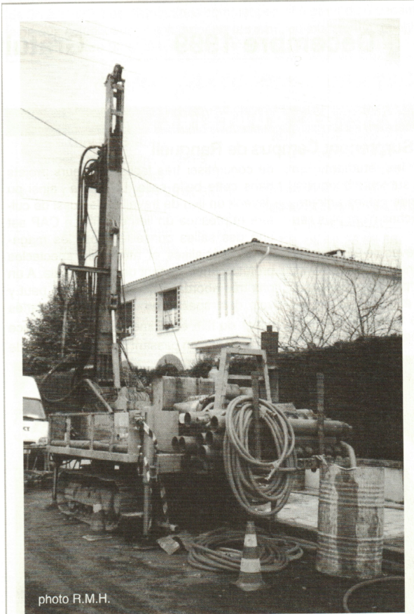
Les sondages du sol pour le métro ont repris dans le quartier et le métro est à l'horizon 2004. Nous espérons que cet horizon-là ne reculera pas au fur et à mesure que nous avancerons !